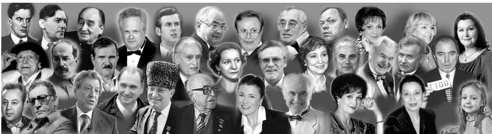
Кем жил, кем живет и кем будет жить ЦДРИ

С 80-летием, наш дорогой Дом! Поздравляем всех, кто работает и бывает в нём!