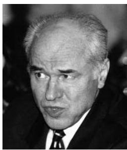
Евгений Дога, композитор, народный артист СССР