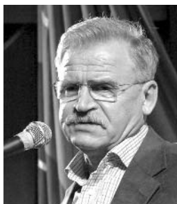
Сергей Николенко, народный артист России