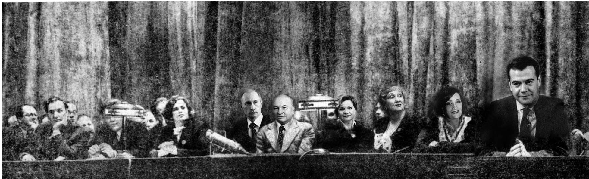
Сон в Новогоднюю ночь: Президиум торжественного собрания в честь 80-летия ЦДРИ. Наваян фото 30-х годов: М. И. Калинин встречается с ЦДРИ