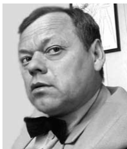
Станислав Железкин, народный артист России, художественный руководитель Мытищинского театра кукол «Огниво»